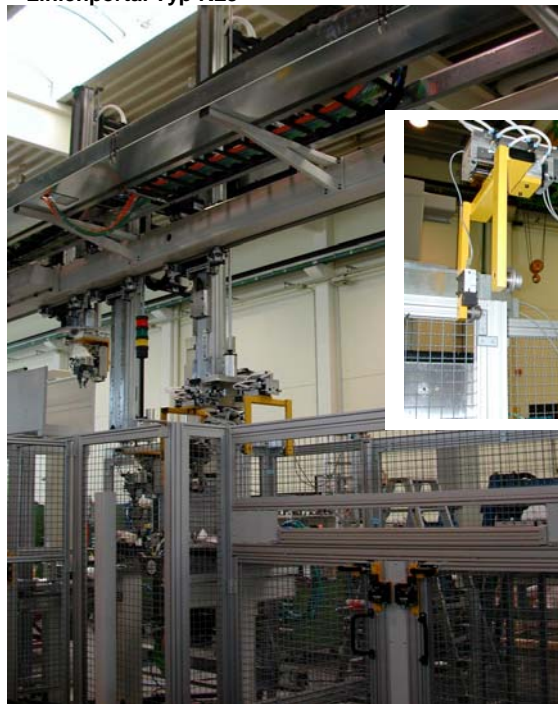
Modul Werkstückgreifer und Korbgreifer