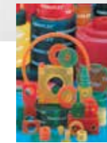
FIBROFLEX® ▲ Özel parçalar

Klasik olmayan çözümler, hassas yüzeyler ve küçük seri imalata yönelik özel çözümler için şekillendirme elemanları olarak plakalar, borular ve profiller. Tampon, sıyrıcı ve itici olarak ilginçtir.