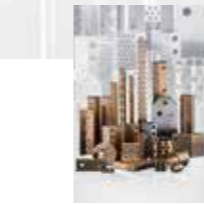
Bakım gerektirmeyen kaydırma elemanları

Kalıplar ve ekipmanlar için kılavuz elemanlar: Kayar, makaralı veya bilyeli kılavuzlu çeşitli modellerde kılavuz sütunlar ve kılavuz kovanlar.