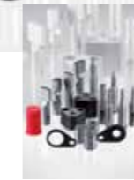
Delici takımlar ▲ Otomotiv sektörü için

Kesme zımbaları, kesme zımbaları ve kesme kovanları için bağlantı plakaları, itici pimleri, silindirik pimler, test pimleri, tarih zımbası, delme ve kabartma üniteleri.