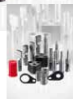
자동차 산업용 펀치