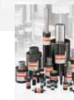
금형 제작용 스프링, 포밍, 기계 및 장치 제작, DIN ISO 10243 을 따르는 특수 나사 압력 스프링, 접시 스프링 및 스프링 형태 요소, 플라스틱 스프링, 가스 스프링. 모든 FIBRO 가스 스프링은 압력 기기 지침(PED) 97/23/EC 을 따릅니다