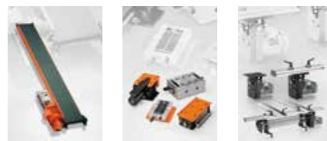
◀◀ 전기식 컨베이어벨트 ◀◀ 공압식 컨베이어 ◀ 전기 기계식 컨베이어