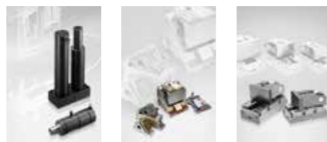
◀◀ 유압캠 ◀◀ 경사캠 ◀ 롤러캠