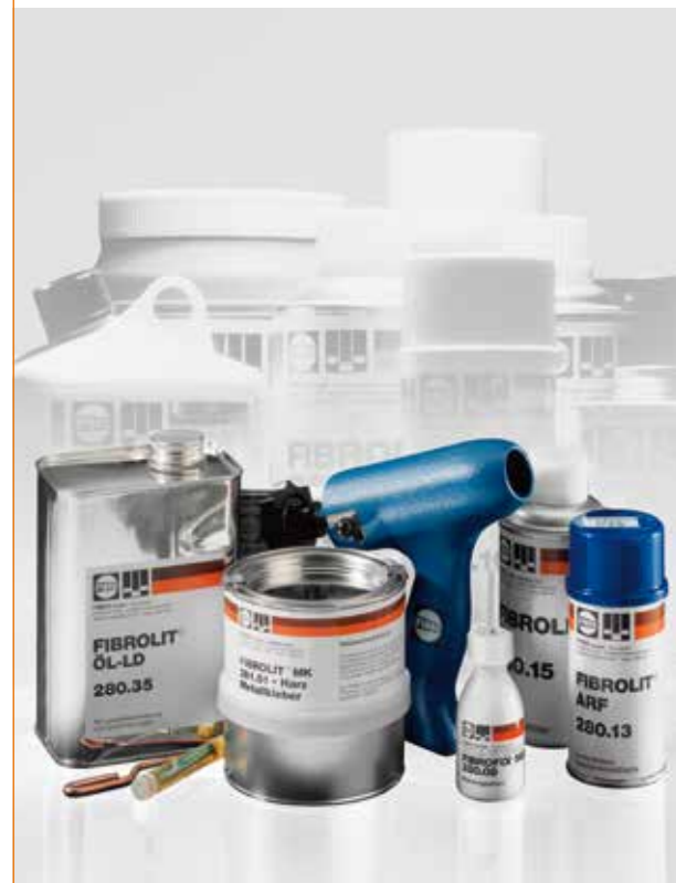
특수 금형 주형용 수지, 금속 접착제 및 화학계동 부품.