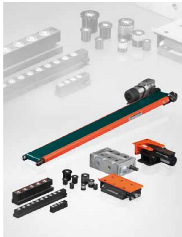
볼 인서트, 볼 레일, 공압 전기 컨베이어 벨트, 공압 바이브레이터