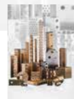
정비가 필요없는 슬라이딩 요소