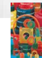
FIBROFLEX® 특수 부품