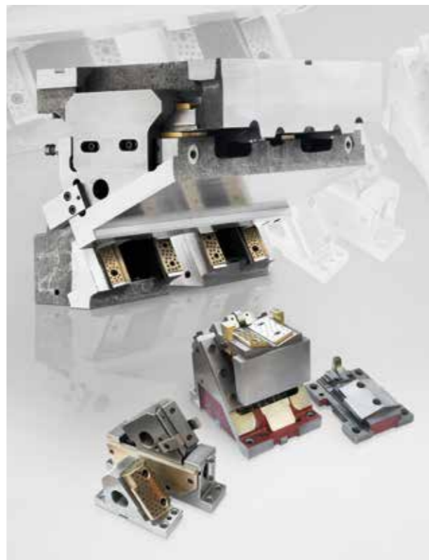
캠(FIBRO 소형 캠, KBV1 및 KBV2)