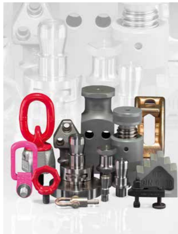
Nez, tourillons de levage, anneaux de levage, goupilles de manutention à billes, supports annulaires, broches et chapes de manutention, bride et bride à hauteur réglable, supports ajustables, cale à gradins, vis de réglage, coffrets-assortiment d'éléments de bridage.