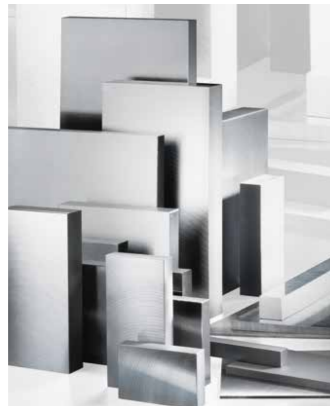
Plaques en acier et aluminium, acier plats et carrés, acier d'outillage, lames calibrées de précision et feuilles calibrées de précision.