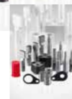
Poinçons et matrices pour ▲ l'industrie automobile