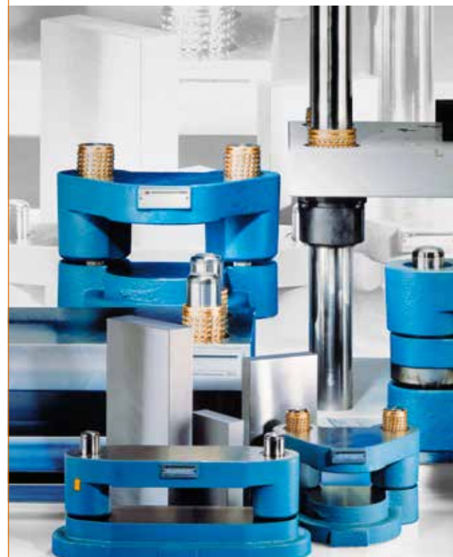
Blocs à colonnes en fonte, aluminium ou en acier.