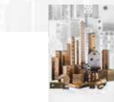
Éléments de frottement ▲ à entretien réduit