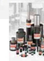
Ressorts pour les outillages de découpe-emboutissage et machines spéciales; ressorts hélicoïdaux spéciaux selon DIN ISO 10243; rondelles-ressorts; ressort élastomères; ressorts à gaz. Tous les ressorts à gaz FIBRO sont conformes à la Directive Européenne 97/23/CE.