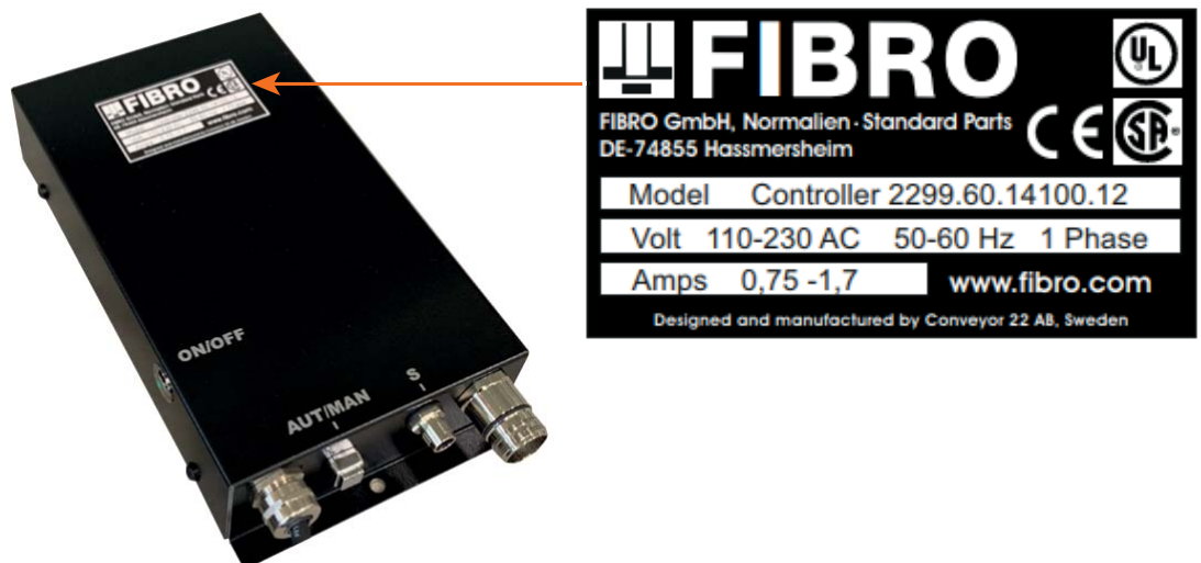
Fig. 3-3 Placa de características

En la unidad de control está colocada una placa de características. Para realizar cualquier consulta o pedido, debe indicarse la información que aparece en la placa de características.