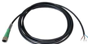
Fig. 3-5 Câble des signaux

Le câble des signaux relie l'unité de commande à un dispositif externe.