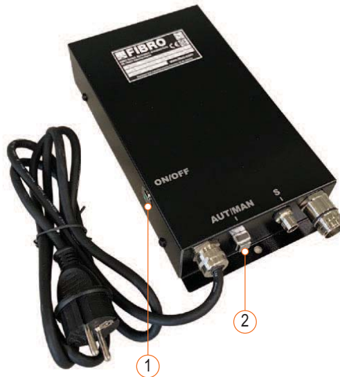
Fig. 6-1 Elementi di comando centralina di controllo BLACK LINE