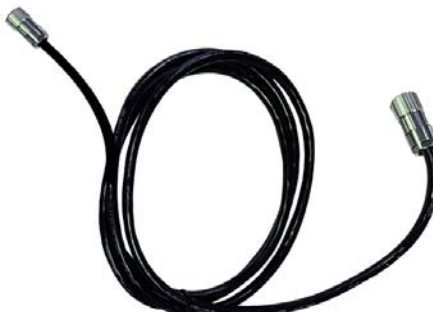
Fig. 3-4 Cavo di collegamento

Il cavo di collegamento collega la centralina di controllo con il convogliatore elettrico.