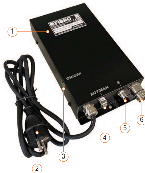
Fig. 3-1 Componenti della centralina di controllo BLACK LINE