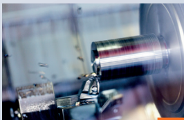
Sériová výroba na nejvyšší úrovni se specifickým zákaznickým značením a balením