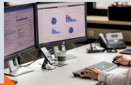
Nepřetržitá komunikace s našimi odborníky