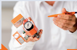
Vývoj produktu od prvního vzorku až po konečný produkt