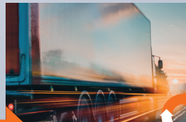
Spolehlivý zákaznický servis a dodání, také „just-in-time“