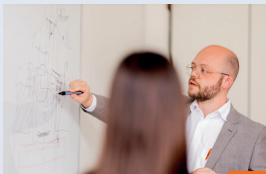
Projektová a konstrukční podpora

Na základě technických výkresů, údajů a specifikací vás podpoříme při návrhu vašeho individuálního řešení pro konkrétní konstrukci a vyrobíme ji podle nejvyšších výrobních standardů, aby byly splněny vaše požadavky.