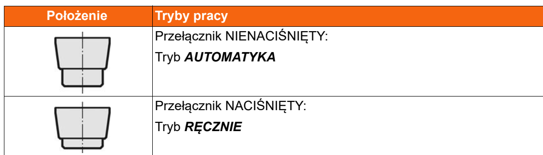
Tab. 6-1 Wybór trybu pracy

Ustawić tryb pracy przełącznikiem AUTOMATYKA / RĘCZNI.