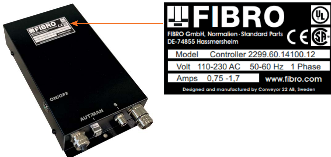
Rys. 3-3 Tabliczka znamionowa

Na jednostce sterującej umieszczona jest tabliczka znamionowa. W przypadku jakichkolwiek pytań i zamówień należy podać dane znajdujące się na tabliczce znamionowej.