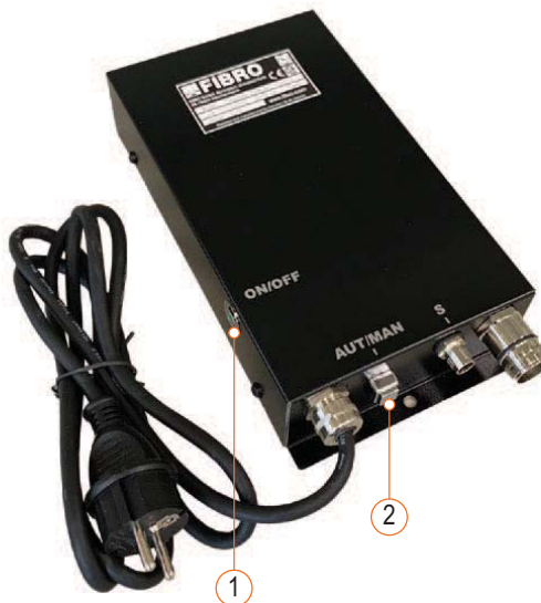
Rys. 6-1 Elementy obsługi jednostki sterującej BLACK LINE